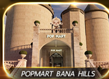
POP MART BANA HILLS

สัมพัสความงามหมู่บ้านฝรั่งเศสที่บานาฮิลล์ ซอปปิง POPMART