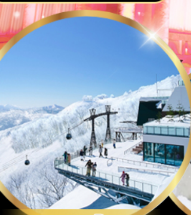
จุดชมวิว Unkai Terrace