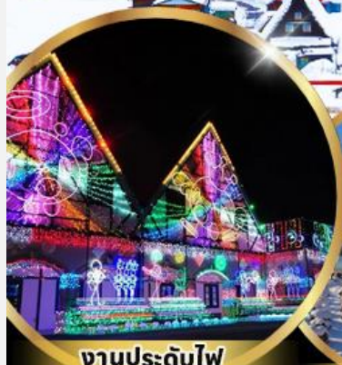
งานประดับไฟ Tokyo german village