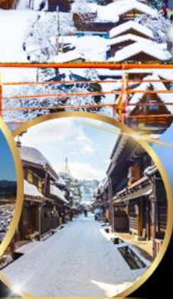
ทาคายาม่า