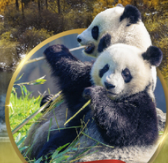
ศูนย์หมีแพนด้า

เที่ยวชมความงาม 3 อุทยานชื่อดัง : สี่ดรุณี • ปี้เฟิงโก ต้าตุ่กลาเซียร์ ชมความน่ารักของหมีแพนด้า • จัตุรัสหยางเทียนวู่ ชอยกว้างชอยแคบ • ถนนคนเดินซุนซีลู่ • POP MART