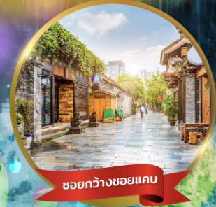
ชอยกว้างชอยแคม