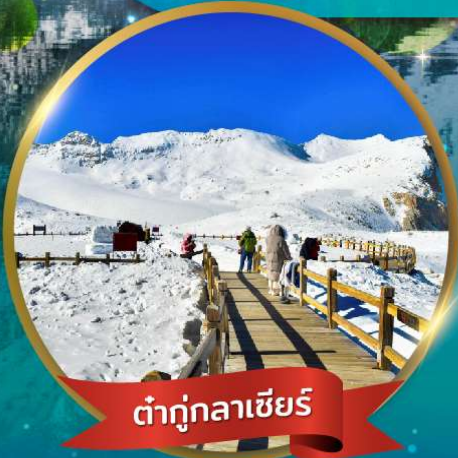
ต่ากู่กลาเซียร์