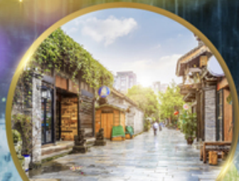
ชอยกว้างชอยแคบ