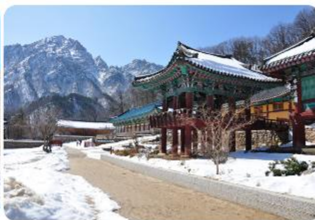
แห่งนี้ได้