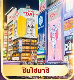
ชินไซบาชิ