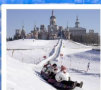
ฤดูหาลานวอลการ