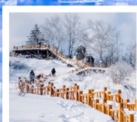
เขากระหลว้า