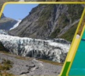
ธารน้ำแข็ง FOX GLACIER