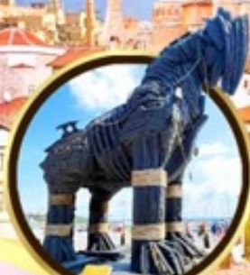
น้ำไม้เมืองทรอย