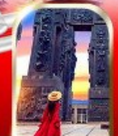
THE CHRONICLE OF GEORGIA