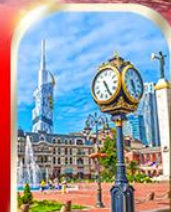
BATUMI CITY ADJARA

เมืองท้ำอุพลิสซิค ■ ป้อมอนาบูรี ■ นั่งกระเช้าชมเมืองบอร์โจนิ