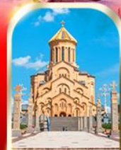
HOLY TRINITY CATHEDRAL