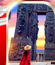
THE CHRONICLE OF GEORGIA