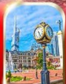
BATUMI CITY ADJARA

เมืองท้ำอูพลิสซิค ■ ป้อมอบาบูรี ■ นังกระเซียมเมืองบอร์โจมี