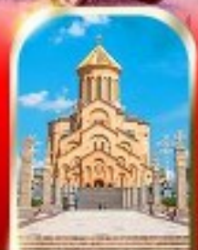
HOLY TRINITY CATHEDRAL