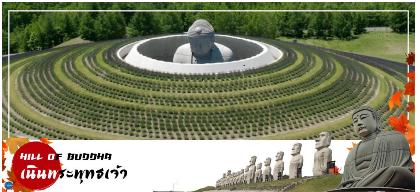
HILL OF BUDDHA เนินพระพุทธรเจ้า

วันที่สอง ท่าอากาศยานนิวซีโดเสะ สอกไกโคโด – เมืองซัปโปโร – เนินพระพุทธรเจ้า – เมืองฟูราโนะ – หมู่บ้านเพนนิยาย นิงเกิ้ลเทอเรส – เมืองอาซาฮิดาวา – อีออน อาซาฮิดาวา