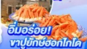
อิมมอร์ออย! ทาปูยักษ์ฮอกไกโด