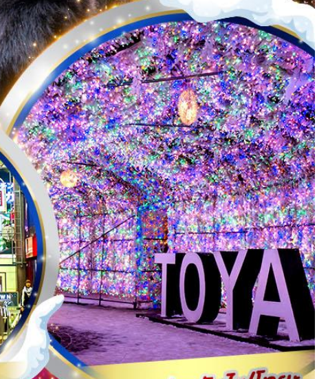
เทศกาลประดับไฟโทยะ