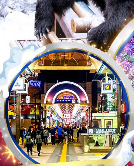
ถนนทานุกิโคจิ