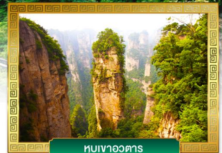
หุบเขาอวดตาร