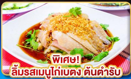
พิเศษ! ลิ้มรสเมนูไก่เบตง ต้นตำรับ

ชมที่สูงสุดของทะเลหมอก อัยเยอร์เวง @เบตง