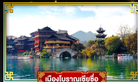
เมืองโบราณเซี่ยซือ