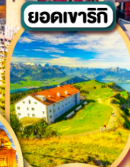
ยอดเขารีกี