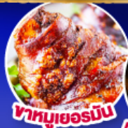
ฟามูเยอร์มิน