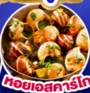
หอยเอสคาร์โก