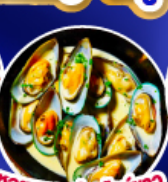
หอยแมลงภู่งอบไวน์ขาว