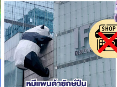
หมีแพนด้ายักษ์ป็น ตึกถนนชุนซีลู่