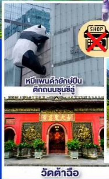
หมีแพนด้ายักษ์ปิ่น ตึกถนนชุนซีอู่