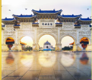
อนุสรณ์สถานเจียงไคเช็ค