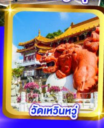
วัดเหวินหวู่