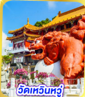
วัดเหวินหวู่