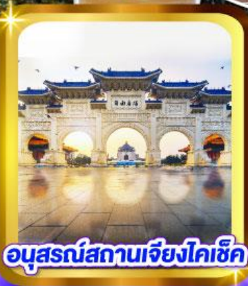
อนุสรณ์สถานเจียงไคเช็ค