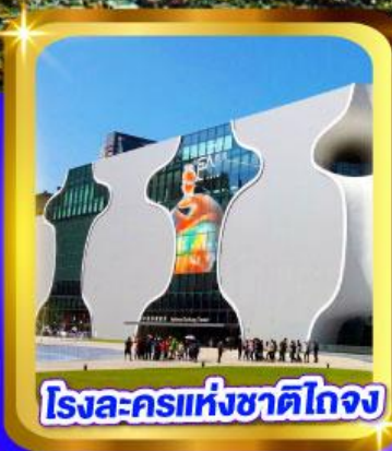
โรงละครแห่งชาติไทจง