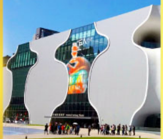
โรจระครแห่งชาติไทจง