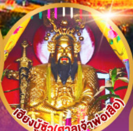
เชียงมูซิว (ศาลเจ้าพ่อเสือ)

เมนูพิเศษ!! อาหารแต่จิว 18 อย่าง ห้ามพลาด! ไม้ต้นตำรับชวเกา สุกี้ซิว