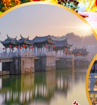
สะพานโบราณกว้างจิ๋ว