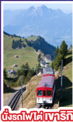
นั่งรถไฟใต้เขาเรริก