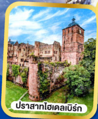
ปราสาทไฮเคลเบิร์ก