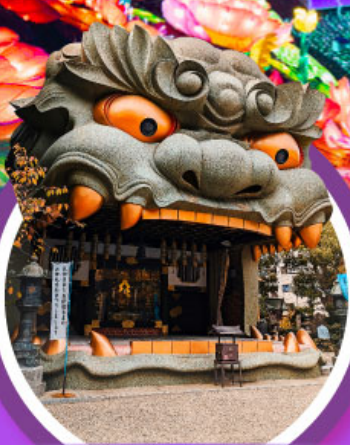
ศาลเจ้านิมบะ ยาชากะ