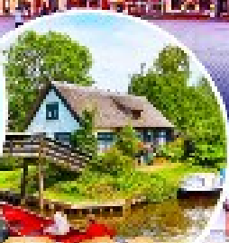
หมู่บ้านกีธูร์น