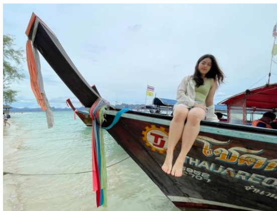
ชมทะเลกระบี่ แวะชม ถ้ำพระนาง , อ่าวไร่เลย์ ชมหน้าผาที่ใช้ในการปีนผาระดับโลก ลักการะศาลพระนาง