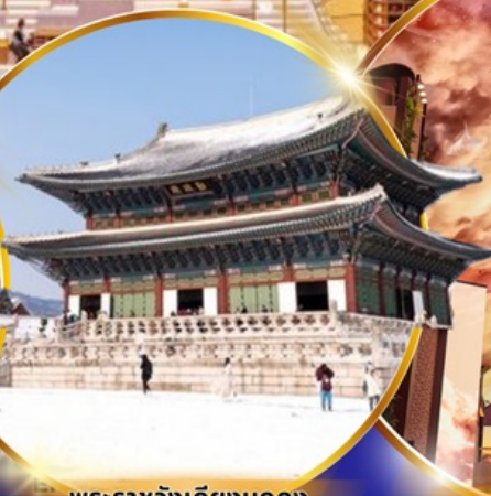
พระราชวังเคียงบกกุง