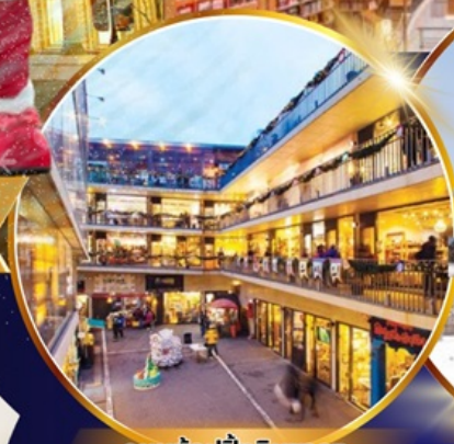
ถนนช้อปปิ้งอินชาง