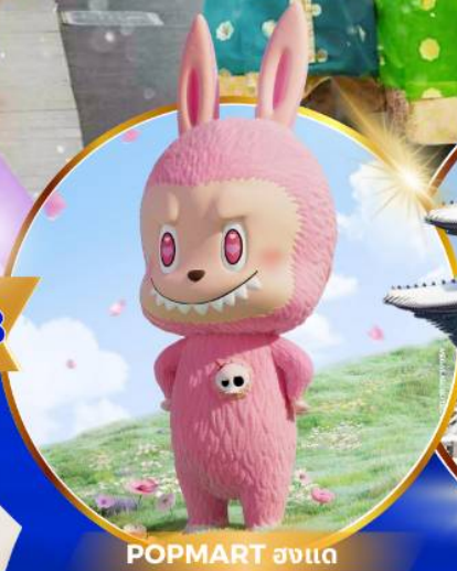
POP MART ฮงแด