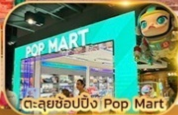
ตะลุยช้อปปิ้ง Pop Mart