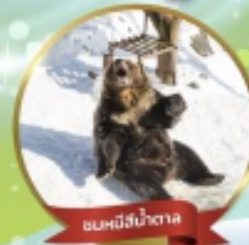
ฟาร์มหมีสึน้ำตาล