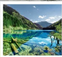
จั๋วจ้ายโกว

จาก 8 ชม. เหลือ 2 ชม. เร็วทันใจด้วยรถไฟความเร็วสูง เมืองตู่ - จั๋วจ้ายโกว