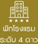
พักโรงแรม ระดับ 4 ดาว