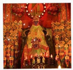
เจ้าแม่กวนอิมวัดสองอ่า