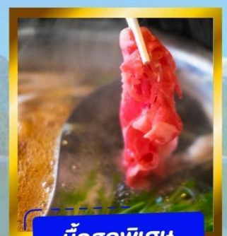
มือสุดพิเศษ