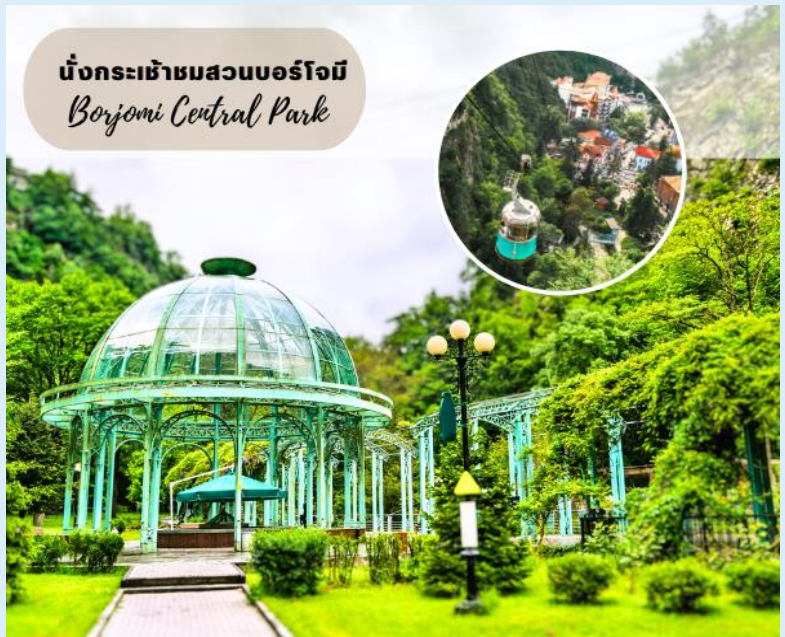
นั่งกระเช้าชมสวนบอร์โจมี Borjomi Central Park

โดยการแช่น้ำแร่ในวันหยุด จากนั้นนำท่านนั่งกระเช้าสู่จุดชมวิวบนหน้าผาเหนือสวนบอร์โจมี