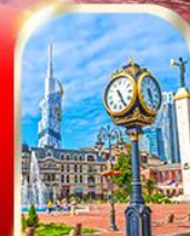
BATUMI CITY ADJARA

เมืองท้ำอุพลิสซิค ■ ป้อมอนาบูรี ■ นั่งกระเช้าชมเมืองบอร์โจนิ อนุสาวรีย์นิตรภาพ รัสเซีย-จอร์เจีย ■ โบสถ์เกอร์เกดี วิหารจวารี ■ มหาวิหารสวตีสคเวลี