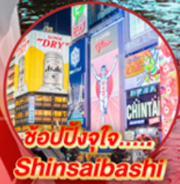
ช้อปปิ้งใจ..... Shinsaibashi

โอโห!! ชมใบไม้เปลี่ยนสีที่สวยงามที่สุดในภูมิภาค ณ หมู่เขาโคริงเค อลังการไฟลันดวณ ณ หมู่บ้านนาบะ โนะ ซาโตะ ชม หมู่บ้านมรดกโลกการ์นต์โดย UNESCO ณ หมู่บ้านชิราคาว่าโตะ ปราสาทมัตสึโมโตะ เป็น 1 ใน 12 ปราสาทดั้งเดิมที่ยังคงสมบูรณ์และสวยงาม ชมสวนสไตล์ญี่ปุ่น และเยือน วัดกิ้นคะคุจิ หรือ วัดเงิน แห่งเมืองเกียวโต