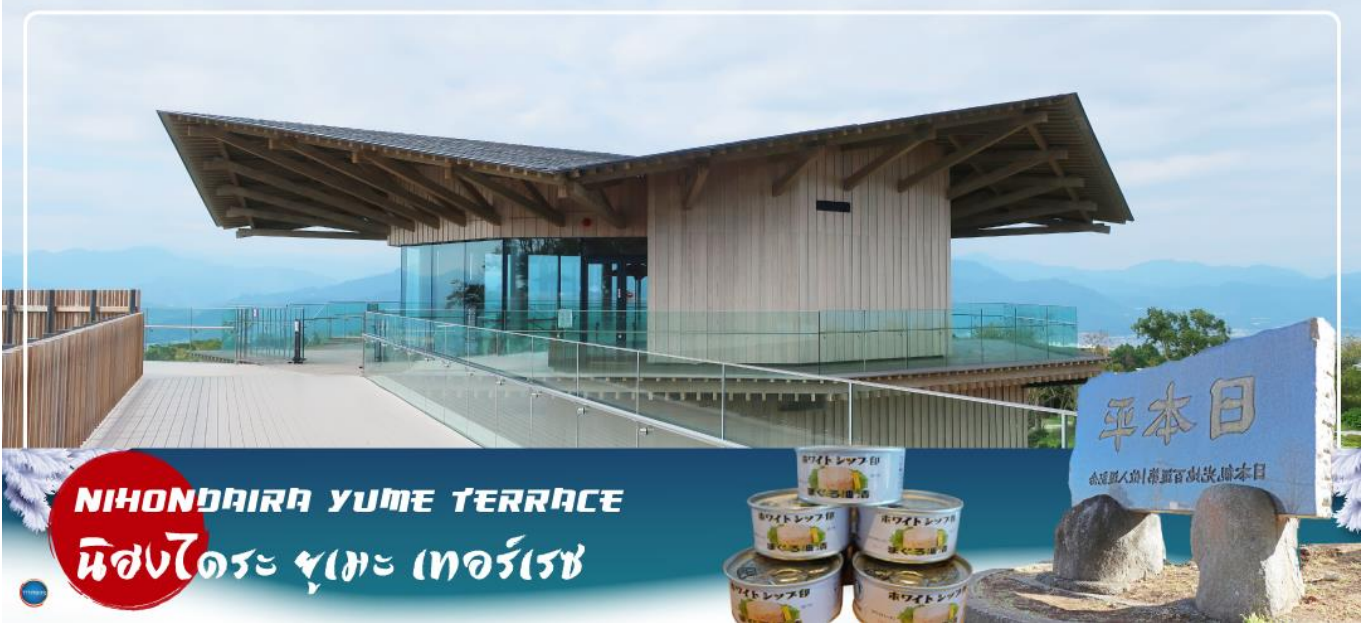
NIHONDAIRA YUME TERRACE นิสงไดระ ยูเมะ เทอร์เรซ