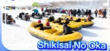
Shikisai No Oka