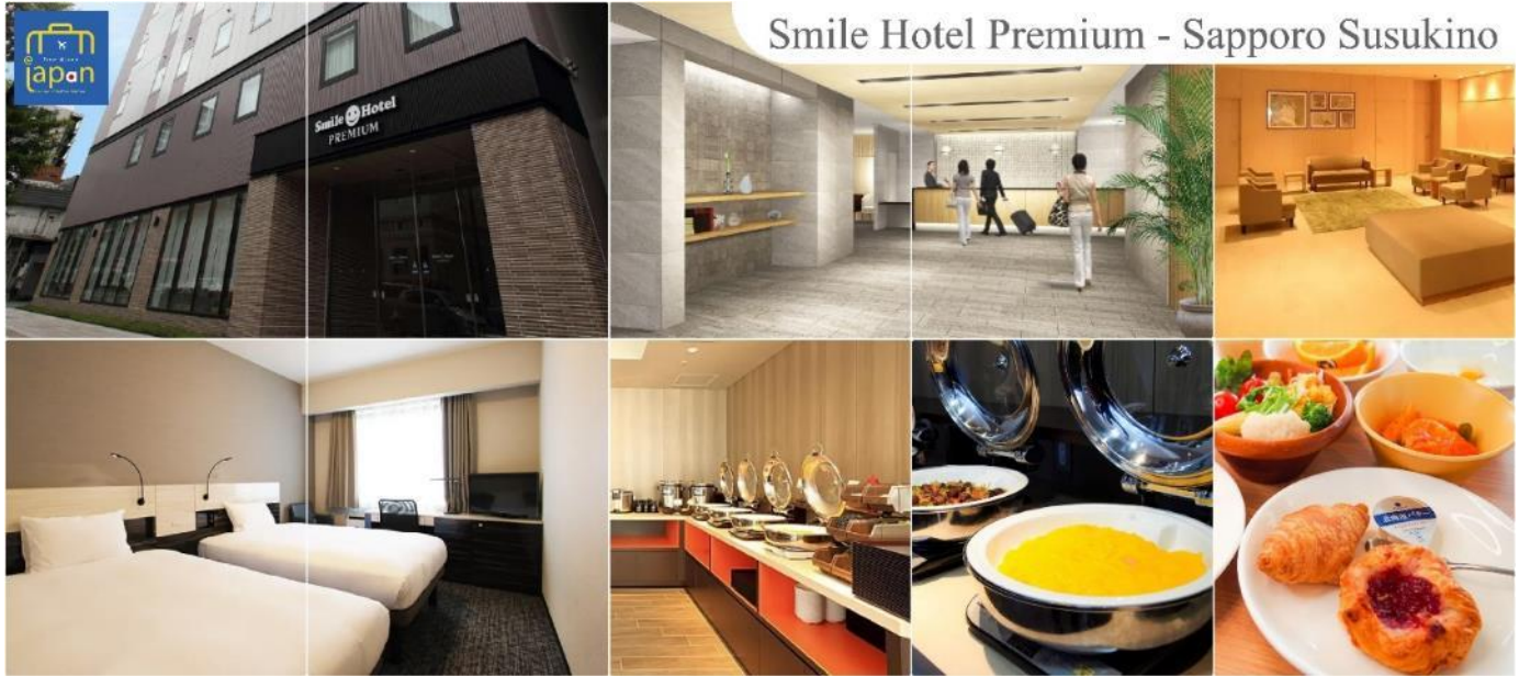
Smile Hotel Premium - Sapporo Susukino

รับประทานอาหารเย็น ณ กัตตาคาร (3) พิเศษ!!! เมนู บุฟเฟต์ซาซิมิ + ซาซิมิ SMILE HOTEL PREMIUM - SAPPORO SUSUKINO หรือเทียบเท่าระดับเดียวกัน