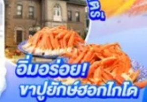
อิมมอร์ออย! ทัพุย์ักษ์ฮอกไกโด