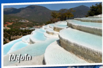
ปี๋สุ่ยโต๋

เที่ยวครบทุกไฮไลต์ • ไม่ลงร้านช้อปปิ้ง • พักโรงแรม 4 ดาว