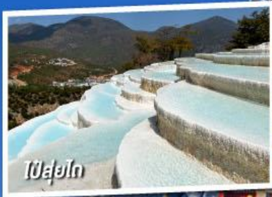
ป๋ายู่โถ

เที่ยวครบทุกไฮไลต์ • ไม่ลงร้านช้อปปิ้ง • พักโรงแรม 4 ดาว