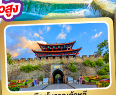
เมืองโบราณต้าหลี่