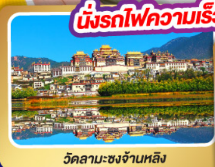
วัดลามะชงจ้านหลิง