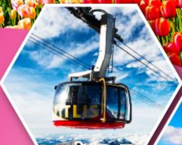
กระเช้าที่ตลีส