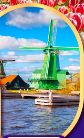
หมู่บ้านกังหันลม ซาสคินส์

08-16 ก.พ.68 09-17, 10-18 เม.ย.68 23 เม.ย.-01 พ.ค.68