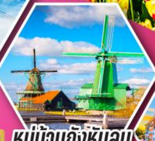
หมู่บ้านกังหันลม ชาสคินส์