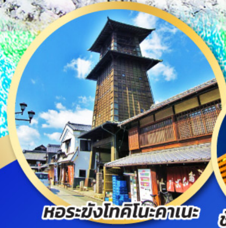
หอรบั้งโทคิโนะคานะ