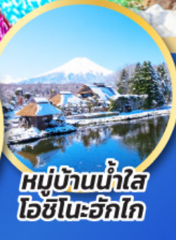
หมู่บ้านน้ำใส ไอชิโนะอัทสึ