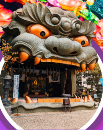
ศาลเจ้านิมบะ ยาชากะ