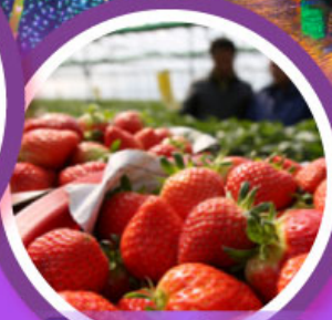
เก็บสดรอว์เบอร์รี่

เดินทาง 04-09, 06-11 ก.พ. 68 14-19, 18-23 ก.พ. 68