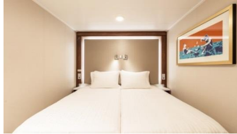
พัก 1-2 ท่าน

From 13 - 14 sq.m Max Occupancy 2-4^ Deck 5/8/9/10/11/12/13/15 2 Single Beds / 2 Single Beds + 1 Ceiling Pullman Bed / 1 Single Bed + 1 Pullman Bed + 1 Double Sofa Bed