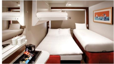
พัก 3-4 ท่าน