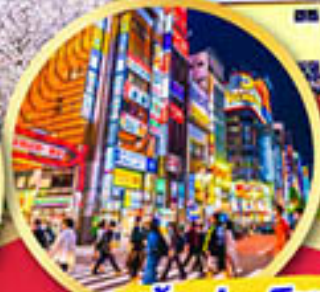
ช้อปปิ้ง ย่านชินจูกุ

พักออนเซ็น 1 คืน , พักโตเกียว 2 คืน บินเข้านาโกย่า-ออกโตเกียว