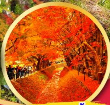
อุโมงค์ใบเมเปิ้ล โมมิจิ โคโร