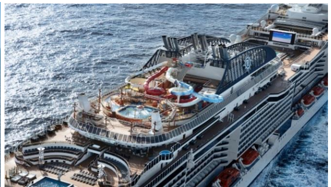
Keelung (Taipei, Taiwan)- Miyako Island-Naha(Okinawa)-Ishigaki(Japan)- Keelung –