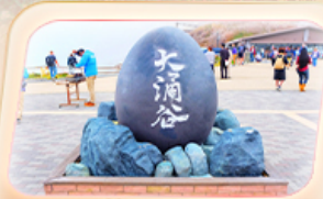
เขมเข่าโขดำโอวาคุดานี