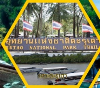
อุทยานแห่งชาติตะรุเตา TRUETA NATIONAL PARK THAILAND