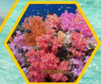
เกาะตาลัง