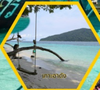
เกาะอาดัง