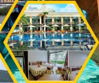
บึงดาหย้า รีสอร์ท