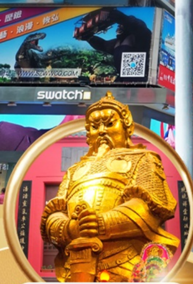
วัดเซกหงฮิว