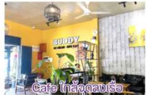
Cafe ใกล้ลงเรือ