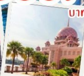
มัสยิดบุตรา