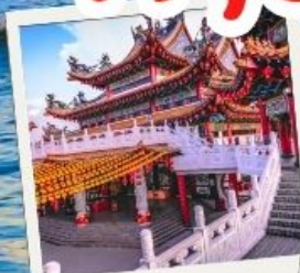
วัดเทียนหัว